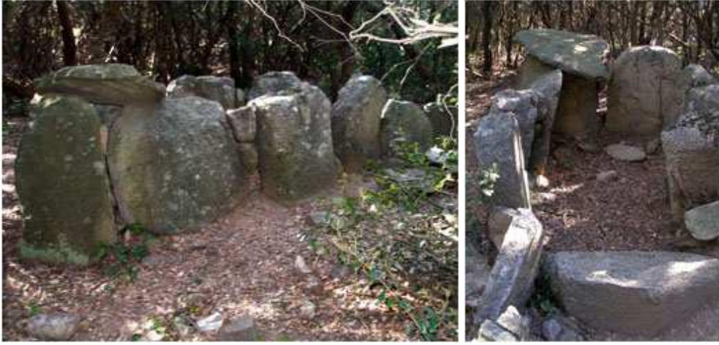
Mapes: ICC, topogràfic 1:25000. Muntatge (2014) i fotografies (2013) de Francesc Baldrís.